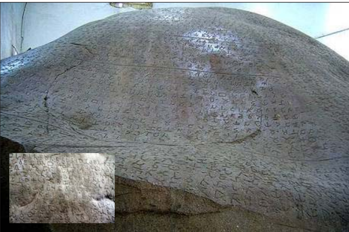
1.2 અશોકનો શિલાલેખ

સાંસ્કૃતિક, પૌરાણિક અને પુરાતત્ત્વીય મહત્વ ધરાવતાં સ્થળોમાં લોથલ (ધોળકા તાલુકો), રંગપુર (લીમડી તાલુકો, સુરેન્દ્રનગર જિલ્લો), ધોળાવીરા (કચ્છ જિલ્લો), રોઝડી અથવા શ્રીનાથગઢ (રાજકોટ જિલ્લો) વગેરે મુખ્ય છે. વડનગરનું