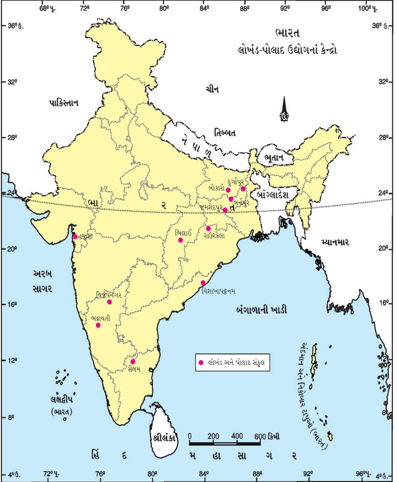
13.2 ભારતમાં લોખંડ પોલાદ ઉદ્યોગનાં કેન્દ્રો

આવ્યાં. લોખંડ-પોલાદ બનાવવા માટે લોહ અયસ્ક કોલસો, ચૂનાનો પથ્થર, મેંગેનીઝનો કાચામાલ તરીકે ઉપયોગ થાય છે. ગુજરાતમાં હજીરા પાસે મીની સ્ટીલ પ્લાન્ટ પ્રસ્થાપિત થયો છે. ટાટા, સિવાયના લોખંડ-પોલાદનો કારખાનાનો વહીવટ, 'સ્ટીલ ઓથોરિટી ઓફ ઈન્ડિયા લિમિટેડ [SAIL] ને સોંપવામાં આવ્યો છે. લોખંડ પોલાદના ઉત્પાદનમાં વિશ્વમાં ભારતનું સ્થાન પાંચમું છે.