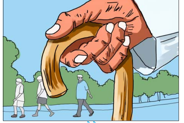
21.4 વૃદ્ધોને સહાય

પશ્ચિમી સંસ્કૃતિ, વિભક્ત કુટુંબમાં રહેવાની ઘેલછાએ સંતાનો આ વૃદ્ધ માતા-પિતા તરફની નૈતિક ફરજો, મૂલ્યો અને સંસ્કૃતિ ભુલાવ્યાં છે. વૃદ્ધ માતાપિતાને આર્થિક મદદ સંવેદના કે લાગણીશૂન્ય વર્તન વ્યવહારથી મજબૂર બનીને ‘ઘરડા ઘરો’ (વૃદ્ધાશ્રમો)માં રહેવાની ફરજ પડે છે. વૃદ્ધોની સમસ્યાઓ પ્રત્યે લોકોનું ધ્યાન ખેંચવા માટે સંયુક્ત રાષ્ટ્રોએ (UN) સન 1999ના વર્ષને ‘આંતરરાષ્ટ્રીય વૃદ્ધ વર્ષ’ તરીકે ઘોષિત કર્યું હતું. તેમ જ પ્રત્યેક વર્ષે તા. 1 લી (પહેલી)