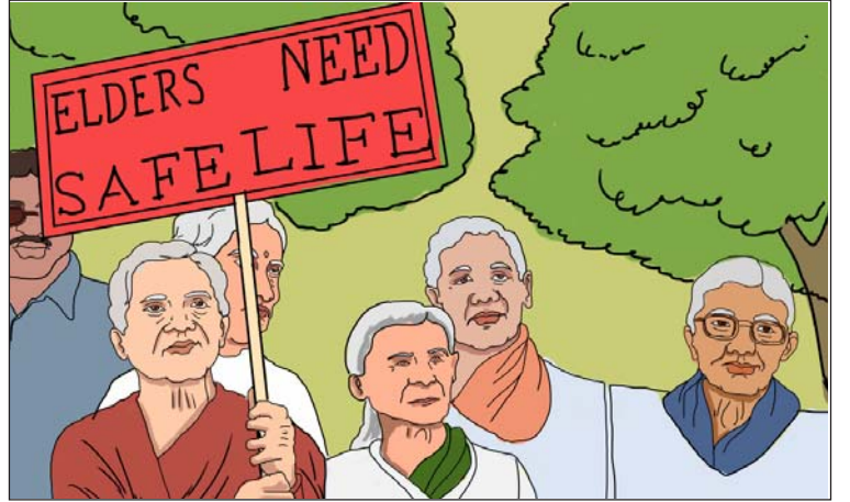
21.5 વૃદ્ધોને રક્ષણ સલામતી

ઓક્ટોબરના દિવસને ‘વિશ્વ વૃદ્ધ દિન’ તરીકે આંતરરાષ્ટ્રીય સ્તરે ઉજવવામાં આવે છે.