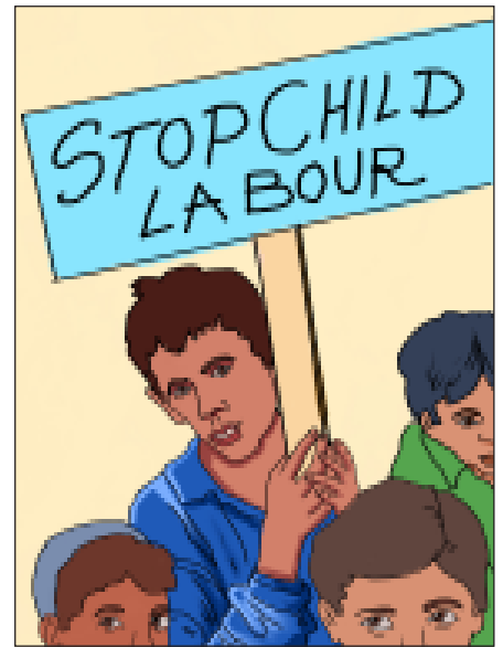
21.3 બાળમજૂરી અટકાવો

બંધારણીય જોગવાઈઓમાં (અ) 14 વર્ષથી ઓછી વયના બાળકને કોઈ કારખાનામાં કે કોઈપણ કામ-ધંધામાં કે વ્યવસાયમાં નોકરીએ રાખી શકાશે નહિ. આના ભંગ બદલ નોકરીદાતા સામે કાનૂની રાહે પગલાં ભરીને સજા કરાવી શકાય છે. (બ) બાળપણમાં કે કિશોરાવસ્થામાં તેનું કોઈપણ પ્રકારે શોષણ ન થાય તથા તેને નૈતિક સુરક્ષા અને ભૌતિક સુવિધાથી વંચિત કરી શકાશે નહિ. (ક) બંધારણનો અમલ શરૂ થયાના 10 (દશ) વર્ષમાં 14 વર્ષની ઉંમર સુધીનાં તમામ બાળકોને મફત અને ફરજિયાત શિક્ષણનો પ્રબંધ સરકારે કરવાનો રહેશે. જોકે આ સંદર્ભે કેન્દ્ર